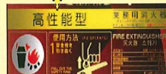
高性能型の表示の一例

※令和 4 年 4 月現在、日本消火器工業会において高性能型消火器と定められている器種です。今後対象器種に変更が生じた場合にはホームページ等でお知らせ致します。